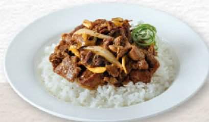
연탄 불고기 덮밥