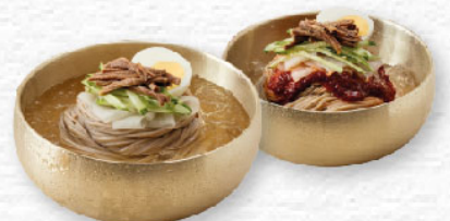
메밀 물, 비빔냉면